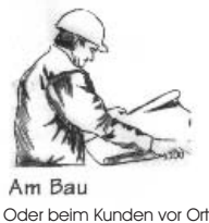
Am Bau Oder beim Kunden vor Ort